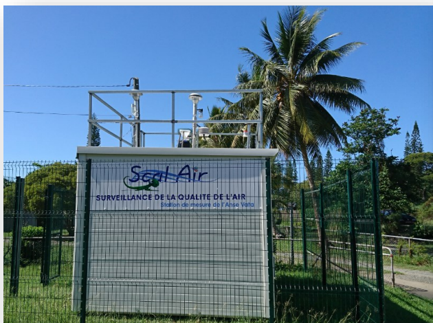
Station Scal'Air de l'anse Vata

Sécurité : chaussures fermées obligatoires.