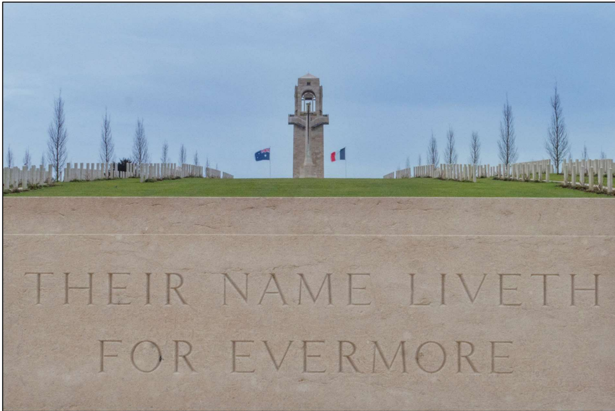
Pierre du souvenir

Dans les cimetières militaires du Commonwealth comprenant plus de 1 000 sépultures, vous trouverez ce bloc de pierre sur lequel sont gravés les mots suivants « Their name liveth for evermore ».